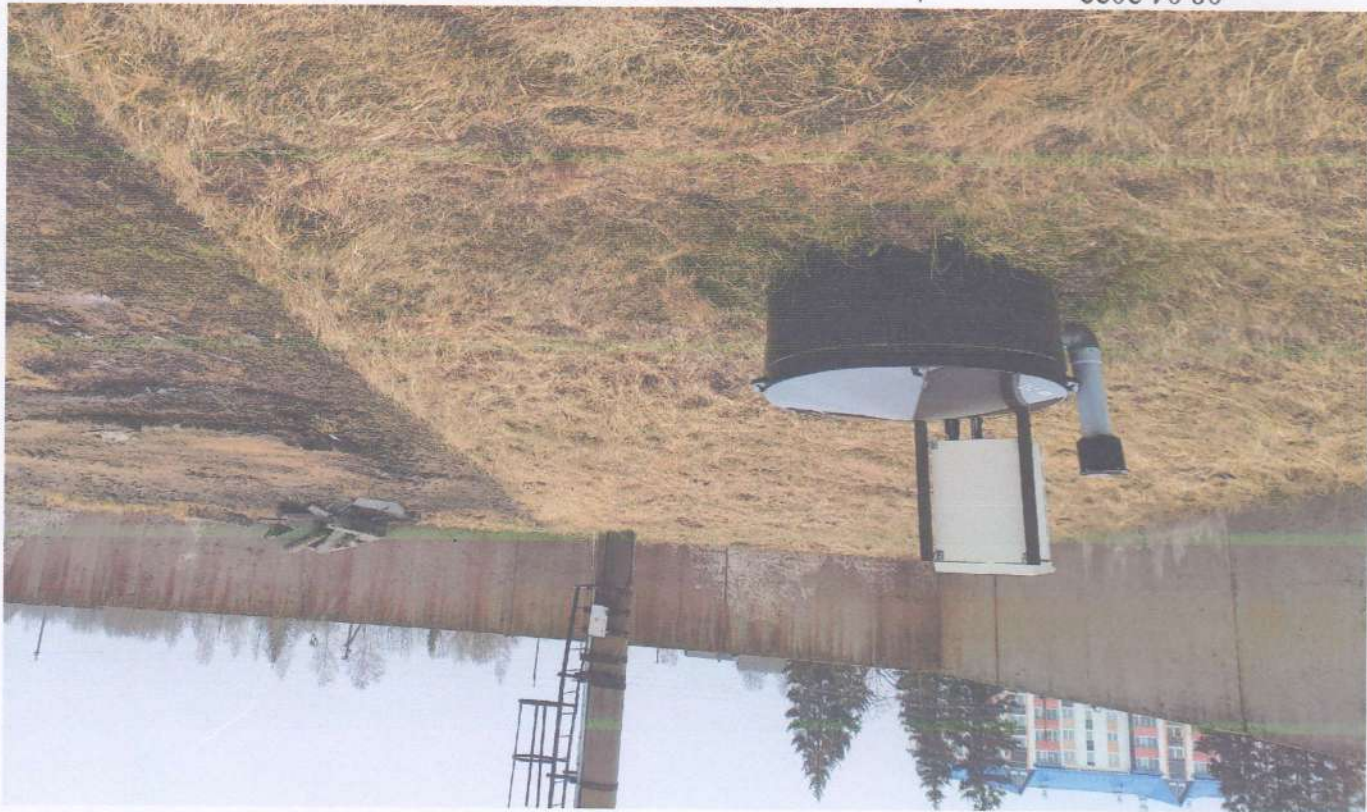
Канализационно-насосная станция бытовых стоков (наименование строения (составного элемента или признака/узелности))