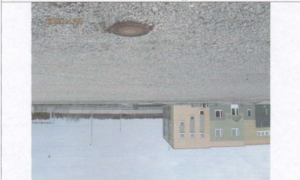
Место прохождение водопровода